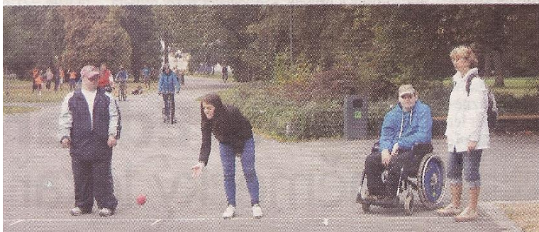
Při sportu se setkaly zdravé i handicapované děti.