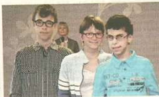
Žáci ZŠ Havlíčkova vytvořili speciální příručku Opavsko v pravěku. Texty v ní jsou převedeny do Braillova písma.