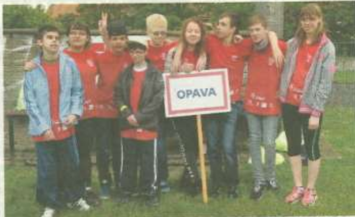
ZŠ Havlíčkova zvítězila na Sportovních hrách zrakově postižené mládeže.