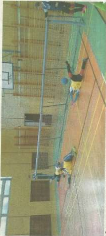
ZŠ Havlíčkova zorganizovala začátkem listopadu turnaj v goalballe.